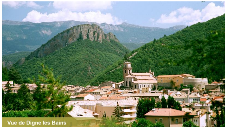
Vue de Digne les Bains